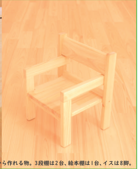
0.1立米の丸太から作れる物。3段棚は2台、絵本棚は1台、イスは8脚。