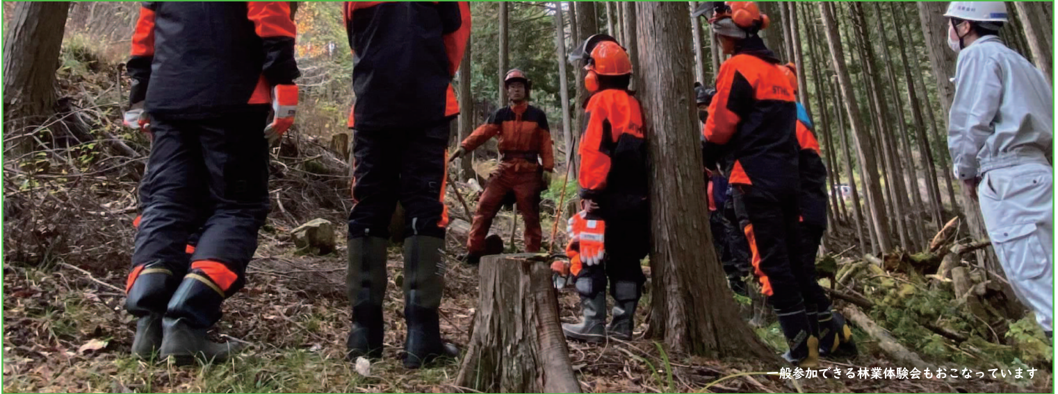
一般参加できる林業体験会もおこなっています